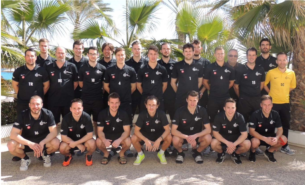
Abbildung: 1. Mannschaft 2015/16 (2. Liga)